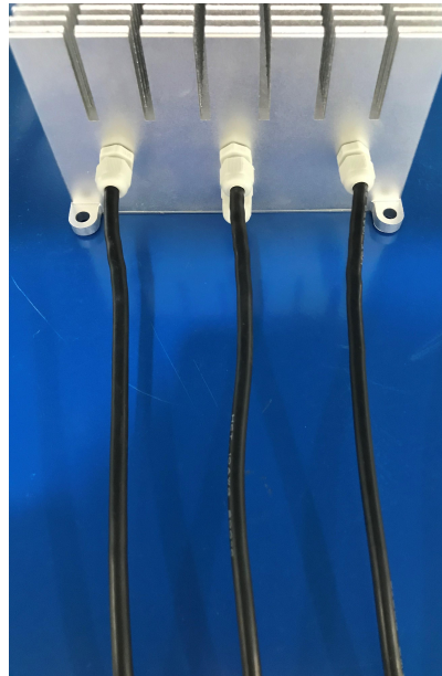
图 2 电调三相输出线

2.1 电调三相输出线：上图 2 中 3 条黑色 10AWG 的硅胶线是连接直流无刷电机的三相输出线。