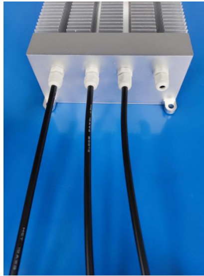
图 2 电调三相输出线

2.1 电调三相输出线：上图 2 中 3 条黑色 10AWG 的硅胶线是连接直流无刷电机的三相输出线。